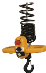
Controles Ergonómicos Digichain™

Aplicaciones de grúas para estaciones de trabajo