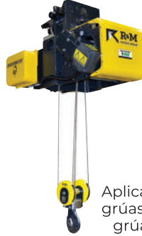
Carro SX para espacios de altura normal

Aplicaciones para grúas monorriel y grúas bandera