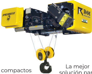
Carro SX compacto para espacios de poca altura