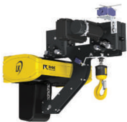
Carro para Espacios de Poca Altura

El polipasto de cadena para espacios de poca altura más económico de la industria