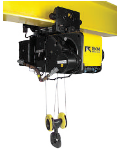
Polipastos EX para Zonas Inflamables y/o Volátiles

Polipastos con clasificaciones ATEX y NEX disponible. Por favor consulte la fábrica.