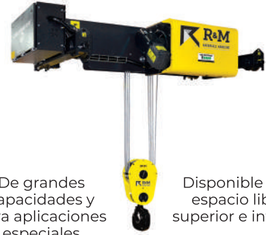
Carro SX para doble viga

De grandes capacidades y para aplicaciones especiales